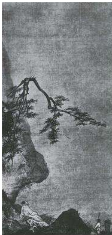
Ма Юань. Лунный свет. Живопись тушью на шелке. XII—XIII вв.